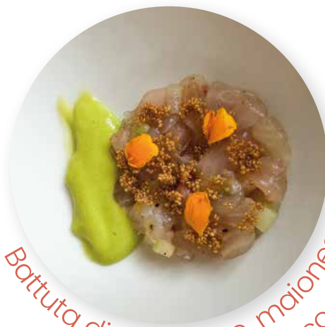
Battuta di Coregone, maionese bianca al sedano levistico, cavolo rapa, agrumi e amaranto

La brigata di cucina diretta da Edoardo Fumagalli, per la sequenza delle 'tavole didattiche' ha elaborato un menù altrettanto stimolante, non solo per la bontà del cibo, pure per porre alcuni stimoli sul futuro della ristorazione, su come coinvolgere i giovani che vogliono diventare cuochi o precisi, preparati addetti alla sala. Così ai tavoli sono stati serviti dei piatti di grande valore, non solo per l'accurata selezione degli ingredienti – Trentingrana ultra stagionato, seguito – l'abbiamo citato in apertura – dal piatto con Coregone. Poi è stata la volta del Risotto